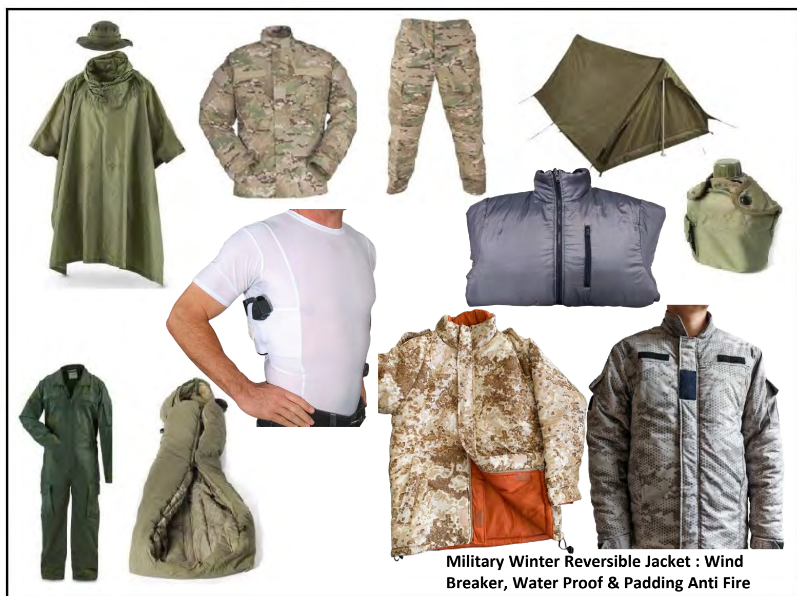
Military Winter Reversible Jacket : Wind Breaker, Water Proof & Padding Anti Fire