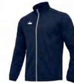
07 NAVY MARINE