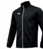
09 BLACK NOIR