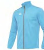
10 COLUMBIA BLEU CIEL