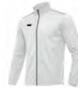
01 WHITE BLANC