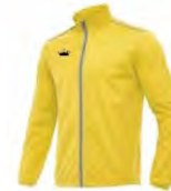
05 YELLOW JAUNE