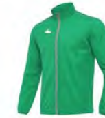
04 GREEN VERT