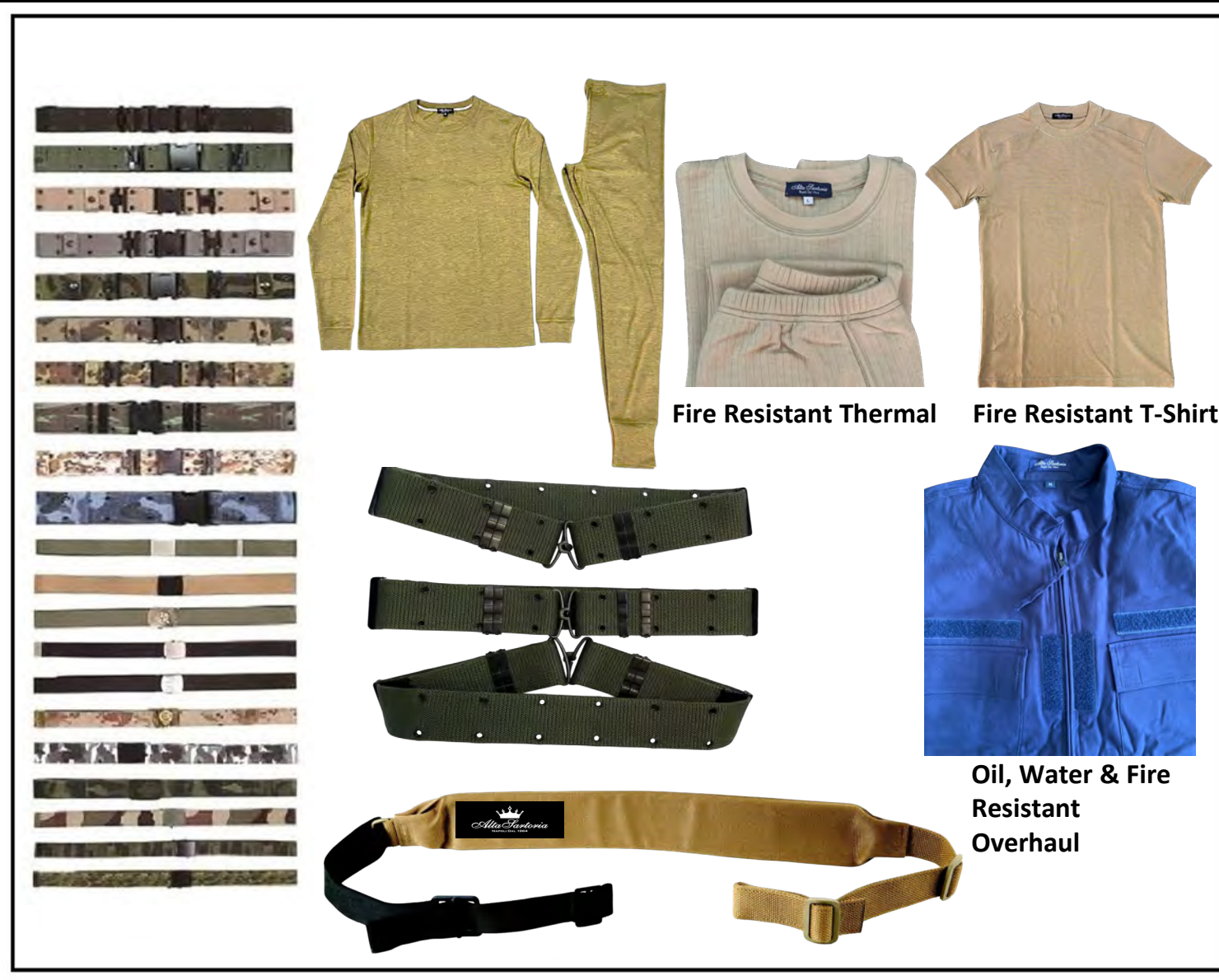
Fire Resistant Thermal