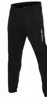
09 BLACK NOIR