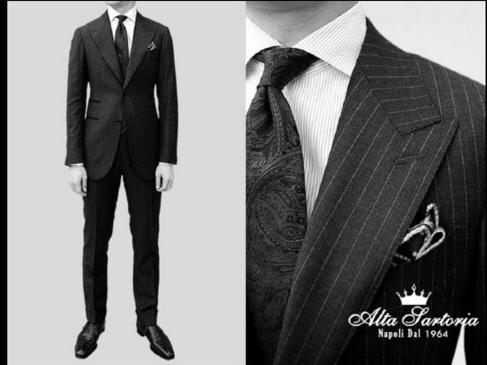
Italian Luxury Fashion