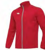
02 RED ROUGE