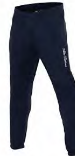
07 NAVY MARINE