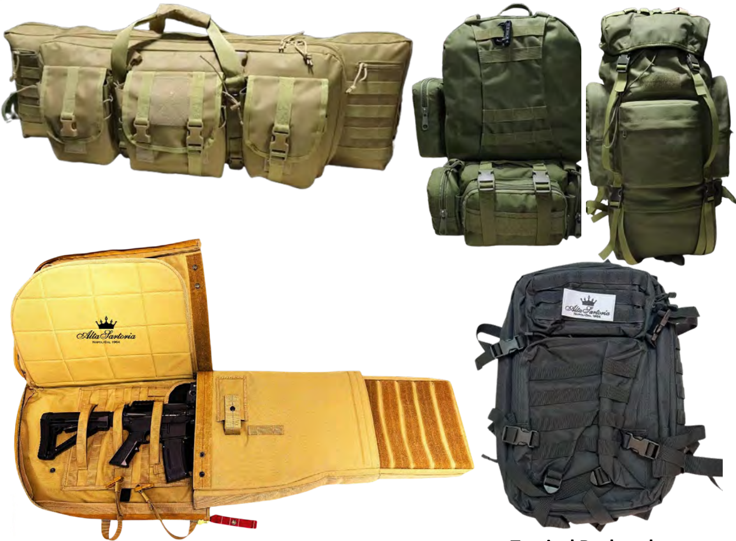
PWC- Parachutist Weapons Case