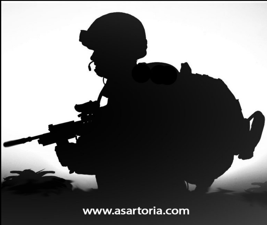
Military Garments and Supplies