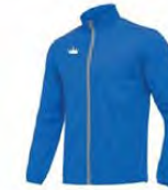
03 ROYAL BLUE BLEU ROYAL